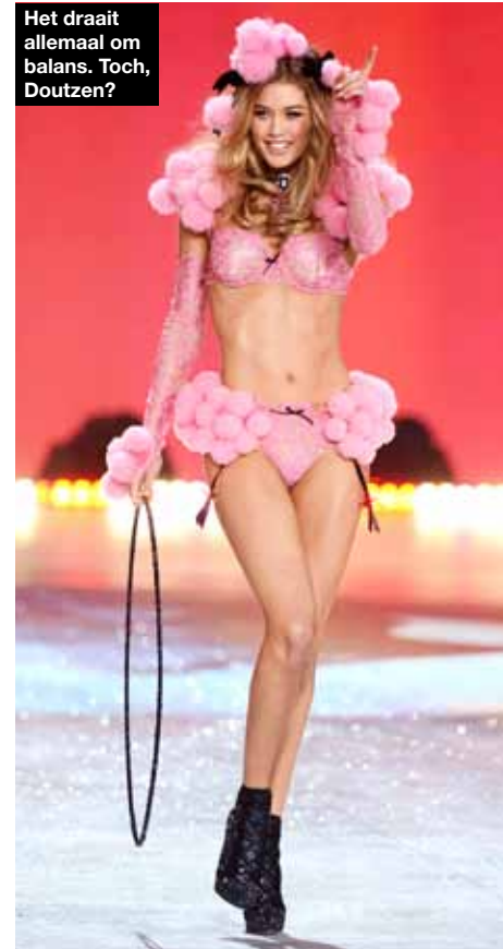
Het draait allemaal om balans. Toch, Doutzen?