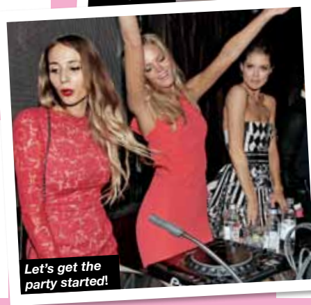
Let's get the party started!