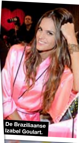
De Braziliaanse Izabel Goulart.