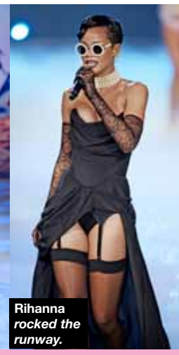
Rihanna rocked the runway.