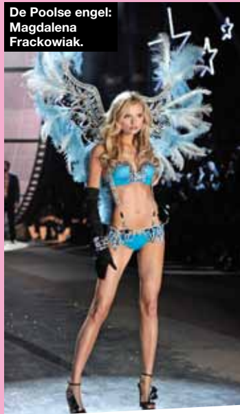
De Poolse engel: Magdalena Frackowiak.

Angel is. Ook zij begint te lachen: "Ik zie mezelf niet als het lekkerste wijf van de wereld. Tuurlijk geeft het mijn zelfvertrouwen een boost dat ik nu een Angel ben. Maar al die andere meiden doen het al veel langer dan ik. Daar kijk ik tegenop. Ik heb me voorgenomen om dit jaar één ding anders te doen dan de eerste keer: ik ga meer lachen. De eerste keer was het een glimlach, nu wordt dat een big smile . Ik ben in vorm, ik heb nu gesport en veel groenten, rijst en vis gegeten. Maar morgen ga ik meteen een hamburger halen!" Ook het Puerto Ricaanse topmodel Joan Smalls die de Victoria's Secret Fashion Show voor de tweede keer loopt, hoeft geen seconde na te denken over wat ze na de show gaat eten. "Een cheesy pizza. Ik heb in de week voor de show elke dag getraind om zo veel mogelijk calorieën te verbranden, maar zodra ik de kans krijg, haal ik er meteen een. Ik kan niet zonder."