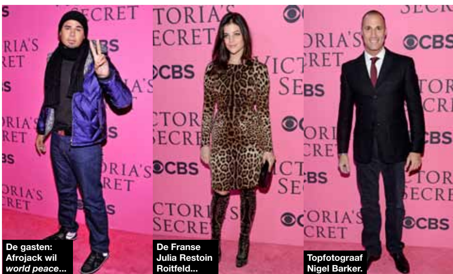
De gasten: Afrojack wil world peace...