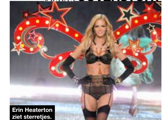
Erin Heatherton ziet sterretjes.