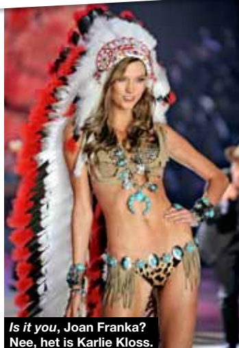
Is it you, Joan Franka? Nee, het is Karlie Kloss.