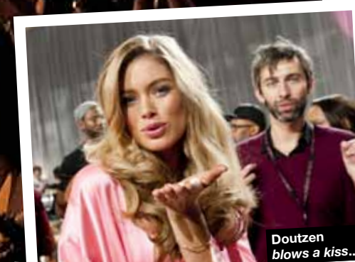
Doutzen blows a kiss...