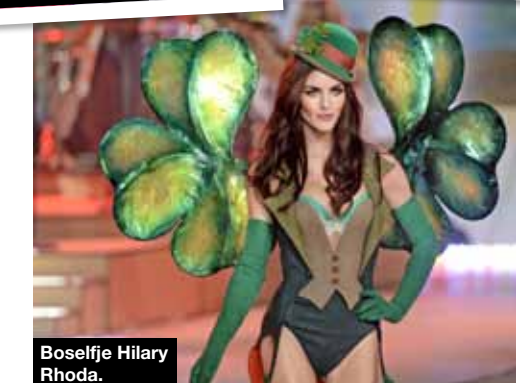
Boselfje Hilary Rhoda.