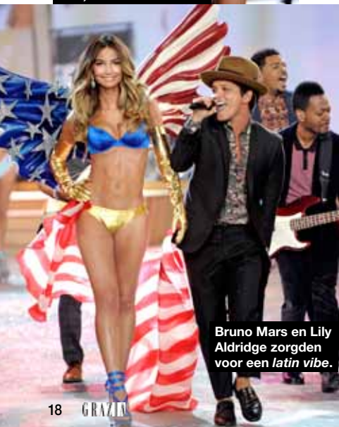
Bruno Mars en Lily Aldridge zorgden voor een latin vibe.