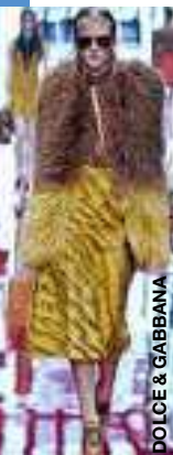
DOLCE & GABBANA